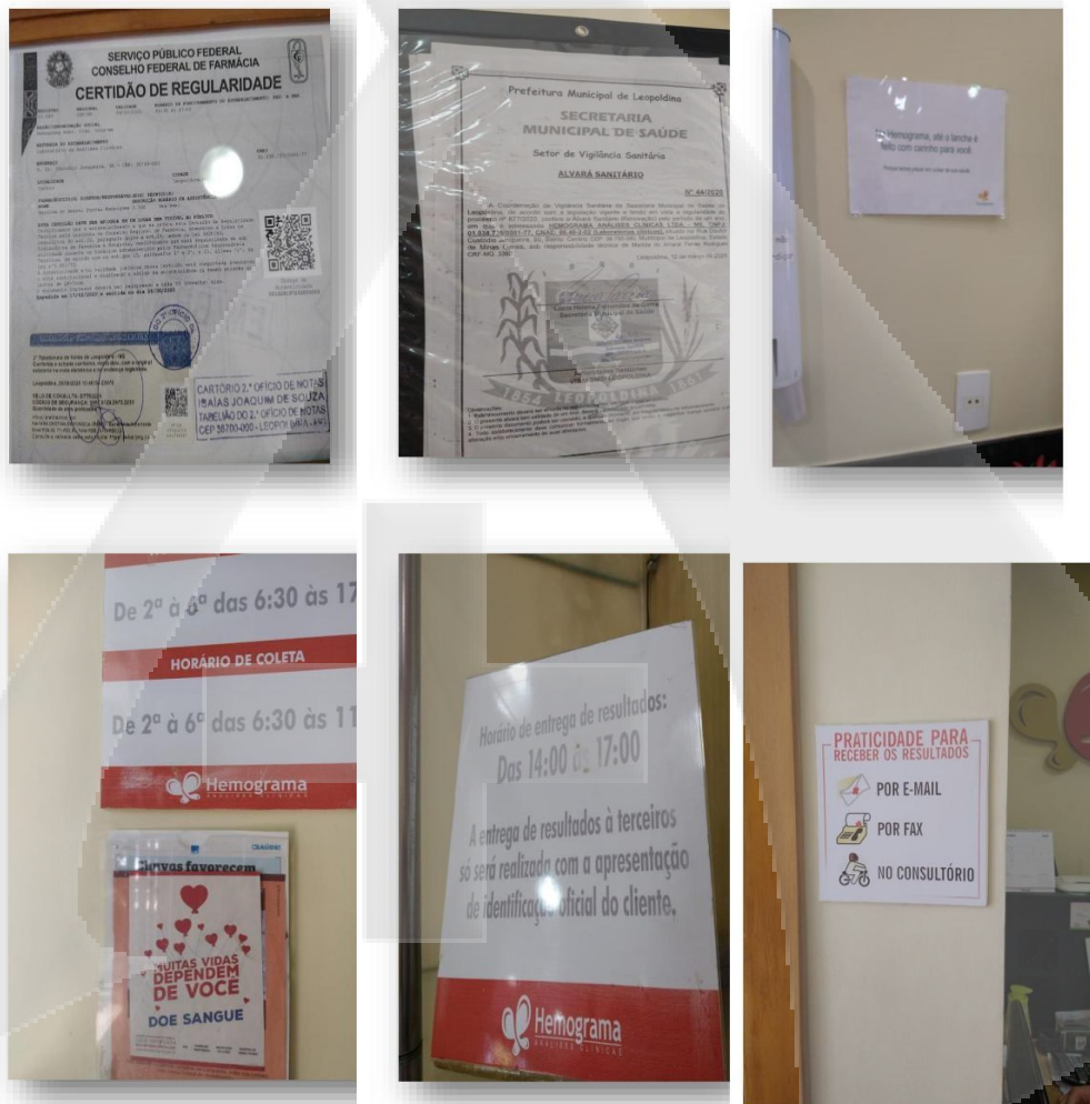
Legenda: Documentos e informativos afixados na recepção do Laboratório