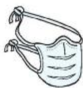
Máscara Cirúrgica (profissional)