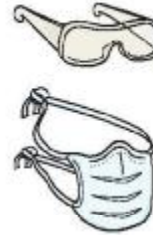
Óculos e Máscara