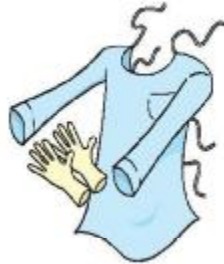
Luvas e Avental